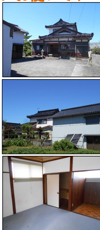
隣地所有者敷地の為、接道要件満たさない道路