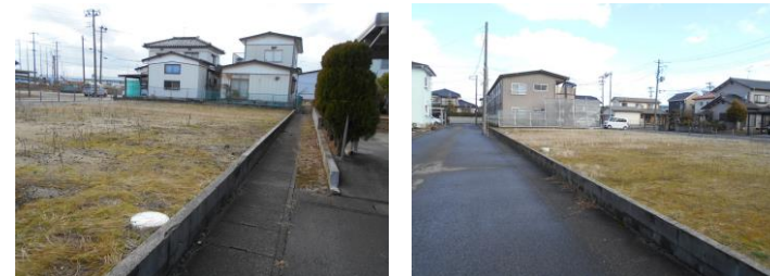
西側 幅員6.0m接道 (段差あり)