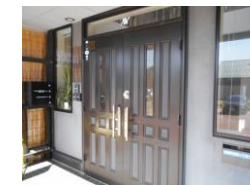
エントランスドア