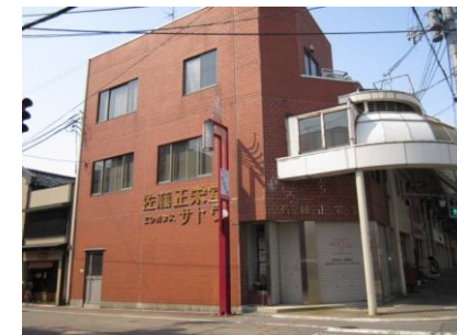
鶴岡銀座通りアーケード内