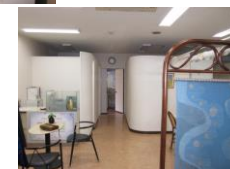
店舗・事務所・教室に!